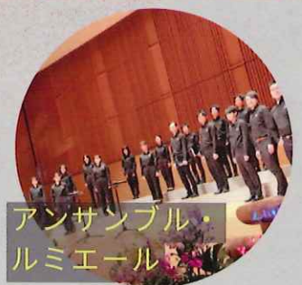
アンサンブル・ルミエール