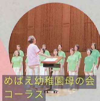
めばえ幼稚園母の会 コーラス

あびこね実行委員会とは 『つながり』をもちながら、その人らしく暮らしていく事を応援するボランティア団体です。