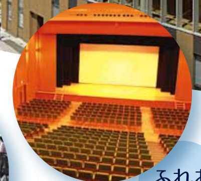
ふれあい ホール (可動式550席)