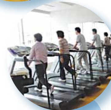
介護予防 トレーニング センター

介護実習・普及センターは介護知識・技術の地域住民への普及・啓発を目的として全国都道府県に設置されていますが、千葉県のセンターは千葉県福祉ふれあいプラザです。